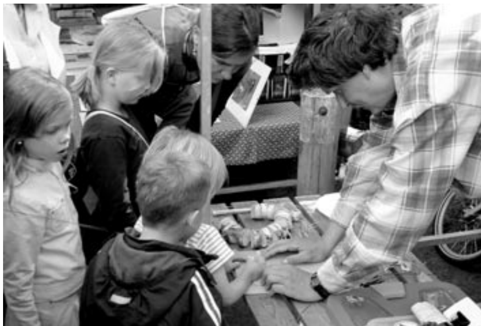
De sPeelkist trekt veel bekijks van jong en oud.

In het kader van het programma 'Leren voor een Duurzame Samenleving' van de provincie Noord-Brabant kregen we in 2004 een projectsubsidie voor het ontwikkelen van een educatiepakket voor docenten basis- en voortgezet onderwijs, IVN-scholengidsen, natuurouders en Peelwerkers. In 2005 kwam het niet helemaal af, maar gelukkig mogen we de eindrapportage en de afrekening ook naar 2006 doorschuiven.