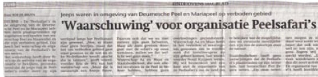
Op alle wegen binnen dit stiltegebied is voor de Peelsafari's de toegang verboden.