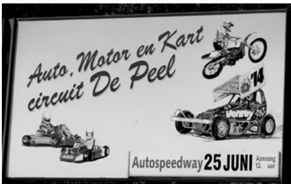
Motorcrossen dient op een plek te gebeuren waar het geen geluidshinder voor de Peel veroorzaakt.

Onze reactie op het voorontwerp Bestemmingsplan 'Buitengebied' van de gemeente Deurne kwam in het vorige jaarverslag al ter sprake. Dit jaar waren we aanwezig bij de opstelling van een uitwerking daarvan: de 'gebiedsvisie bebouwingsconcentraties'. Het maakte nerveus om ambitieus aandoende ontwikkelingslinten ingetekend te zien op de ongewenste plekken midden in de Peel. Eén zo'n lint ligt bijna geheel binnen de Verheven Peel, aan de Oude Peelstraat van Helenaveen tot voorbij het Kanaal van Deurne. Hier ligt een grote landbouwenclave tussen de eigenlijke Deurnese Peel, het Zinkske, het Molentje en de Heitakse Peel in. Door recreatieve ontwikkeling en uitbreiding van een gastuinbouwgebied staat deze strategisch belangrijke zone al zwaar genoeg onder druk. Waakzaamheid blijft geboden vanwege de sterke wens bij sommigen om vooral bij Helenaveen nieuwe economische activiteiten in het buitengebied op gang te helpen. De gebiedsvisie blijkt echter vooral onmogelijkheden in kaart te brengen. Belangrijk is de