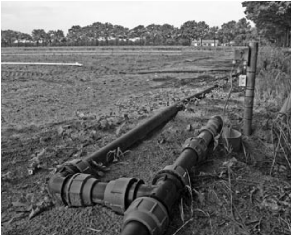
Beregeningsputten in de omgeving van de Peelgebieden, zoals deze bij Helenaveen, pompen in het zomerhalfjaar grote hoeveelheden water weg uit de ondergrond en dragen daarmee bij aan de verdroging van het natuurgebied.

heel de provincie minstens 2900 putten die put 1.1 heten, 1.2, 2.1, etc. Wat het nog veel onoverzichtelijker maakt is dat bij een volgende vergunning dezelfde put opeens een ander nummer kan krijgen!