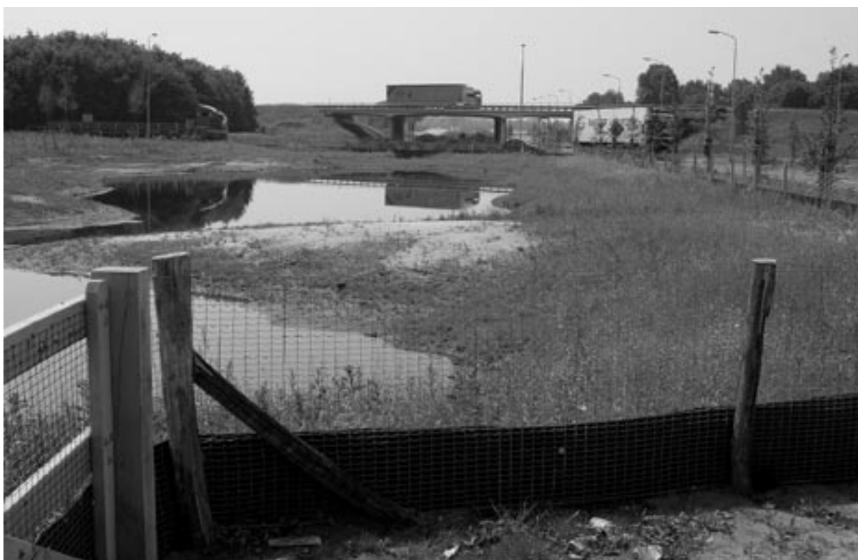
Tegelijk met het verbreden van de Snoertsebaan zijn in de buurt van de op- en afritten van de A67 een aantal faunavoorzieningen aangelegd.

Aan de Padbrugseweg, niet ver van de plek waar een enorm glastuinbouwgebied moet verrijzen, wil de gemeente Deurne een ondernemer ruimte geven voor een windmolenpark van 3 à 4 stuks. De enorme molens moeten bij het Peelnatuurmonument de Bult komen, op nauwelijks 350 meter afstand ervan. Dat is vervelend voor dieren die aan de rand van de Peel leven of die vaak langs- of overvliegen, zoals ganzen. Landschappelijk is het een crime: gevaarten van zo'n 155 meter hoog, kort achter een bosrandje met nauwelijks tien meter hoge berkenboompjes, en ver daarboven uitstekend. Zulke molens zijn zichtbaar op zijn minst van Helmond tot Venray; in de Bult en de Heidse Peel zouden ze wel héél erg overheersend worden. Zowel het landschappelijke aspect als de natuurwaarden zullen nog in een vergunning ex Natuurbeschermingswet, annex Vogel- en Habitatrichtlijn afgewogen moeten worden. De gemeente staat intussen zwak wat betreft de locatiekeuze, omdat men weinig argumen-