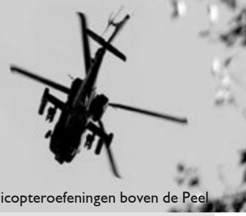
Helicopteroefeningen boven de Peel

Geen oplossing is in zicht voor 'circuit de Peel', waar al heel lang zonder de nodige vergunningen en nota bene binnen de EHS een auto- en motorcrosssterrein wordt geëxploiteerd. Veel omwonenden, de Limburgse Milieufederatie en wij verzetten ons vanwege de grote inbreuk op de rust van deze omgeving en vanwege de kwetsbare natuurwaarden op vliegbasis de Peel, waar zich nog een van de allerlaatste Grutto-populaties van Limburg handhaaft. De gemeente, groot voorstander van het circuit, besloot onder grote druk van zowel natuurbeschermers, burgers als overheden (o.a. de inspectie Ruimtelijke Ordening) eindelijk over te gaan te handhaving, omdat duidelijk is gewor-