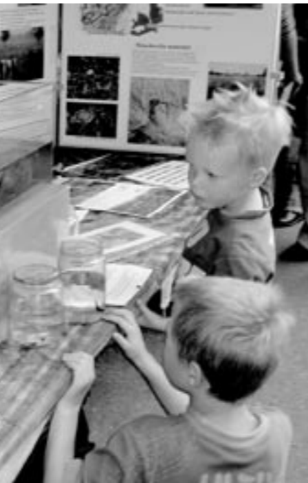
Op onze stands waren de Peel-waterbeestjes een echte publiekstrekker.

Kinderen van een basisschool zijn enthousiast bezig met de Peel-opdrachten.