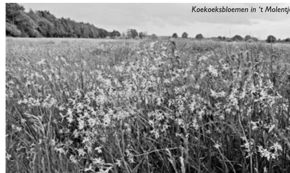
Koekoeksbloemen in 't Molentje

Gelukkig zijn er ook successen te melden. Staatsbosbeheer zet na verwerving van de percelen de rasters een paar meter naar binnen. Hierdoor ontstaan langs de randen overhoekjes en ruigteranden die dankbaar door de fauna in gebruik worden genomen. Zo leverde een heel recente inventarisatie (april 2007) van de Roodborsttapuit maar liefst 30 broedparen op (med. P. van Tilburg). De oudste gegevens dateren uit 1976 en 1986, toen respectievelijk slechts twee en één paar van deze soort werden vastgesteld. In 1998 waren dat er al 10 en in 2000 14. Voor het aantal van 2007 verdient Staatsbosbeheer zeker een pluim. In onze beheersoverleggen met deze natuurbeheerder trachten we meer maatwerk in het beheer in te brengen, zodat in de nabije toekomst we ook een pluim kunnen uitdelen voor successen behaald bij de flora en overige fauna. We houden u op de hoogte.