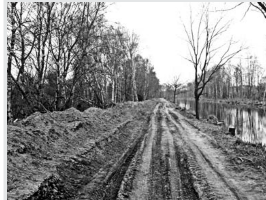
De gemeente Deurne en het waterschap troffen voorbereidingen om de zandweg langs het Deurnese Kanaal te verharden zonder de daarvoor vereiste Natuurbeschermingswetvergunning en ontheffing Flora- en Faunawet.

In de loop van het proces werd duidelijk dat de gemeente Deurne achter het verharden van het zandpad zat, omdat zij van de Europese Unie subsidie zou krijgen als voor een bepaalde datum een recreatief fietspad aangelegd was langs het Kanaal van Deurne. De gemeente heeft geweten dat het verharden van de zandweg in strijd is met het Landinrichtingsplan Peelvenen en de Natuurwetgeving. Desalniettemin heeft zij het waterschap voor haar karretje gespannen. In het kort geding is gebleken dat overheden (gemeente Deurne en provincie Noord-Brabant) en semi-overheden (Waterschap Aa en Maas) zich niet aan de wet wensten te houden. Het is dus niet voor niets dat de rechter een dwangsom heeft opgelegd. Volgens onze jurist is dat niet gebruikelijk, omdat de rechter er normaliter van uit gaat dat een overheid zich wél aan de wet zal houden!