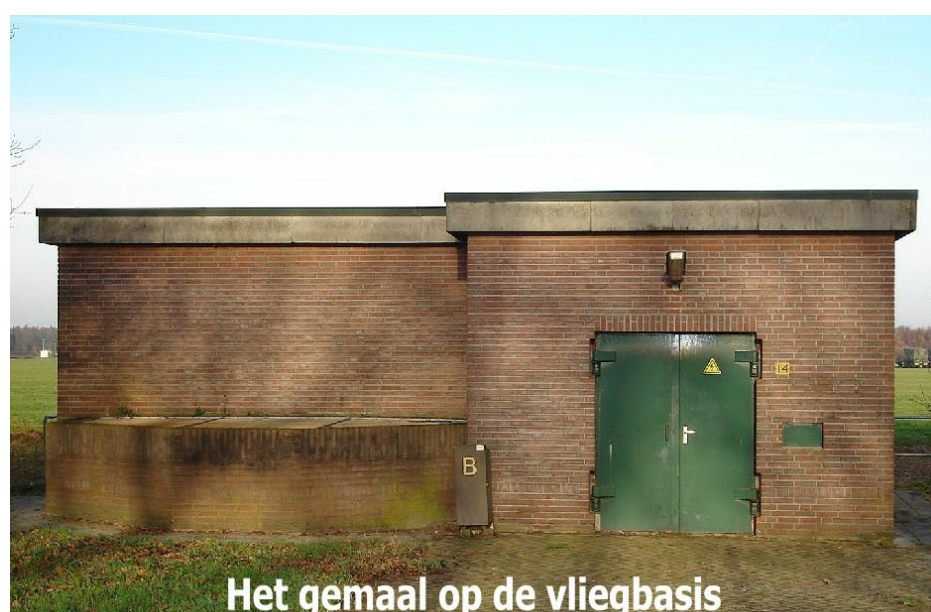
Het gemaal op de vliegbasis

Het gaat om een onderbemaling, met een gemaal met een capaciteit van 600.000 m3 per jaar. De start/landings-banen zijn gedraineerd. Omdat de basis lager ligt dan de omgeving kan de basis haar water niet kwijt via vrij verval. Aan de zuidkant van de basis wordt het water met het gemaal in een sloot van waterschap Aa en Maas gepompt. De Bult (onderdeel van Natura 2000-gebied Deurnsche Peel/Mariapeel) ligt ten zuiden daarvan en is hoger gelegen dan de basis.